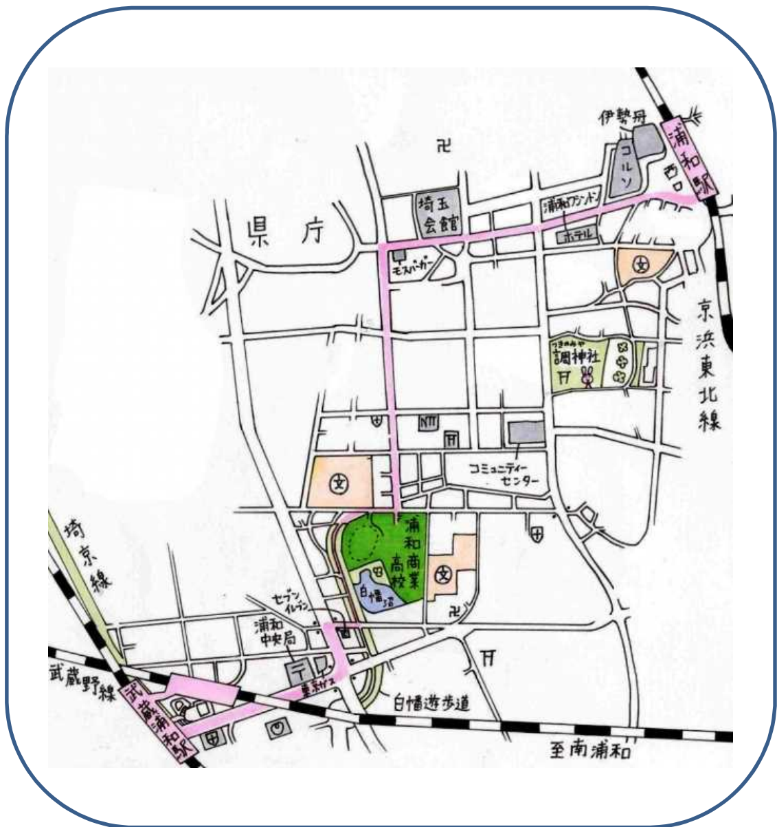
地図提供：埼玉県立浦和商業高等学校